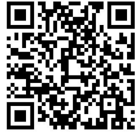
各级政务服务中心公安窗口