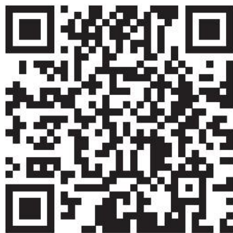
工业技术改造项目备案（企业操作）