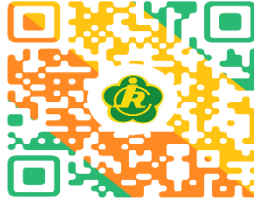
残疾人证类别/等级变更