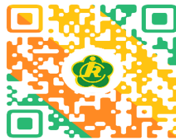
全国残疾人按比例就业情况 联网认证操作指南