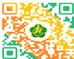
残疾人证挂失补办