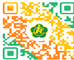
55-59周岁重度残疾人生活 补助申请操作指南