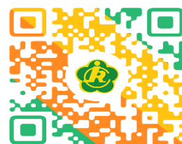
残联权利事项清单