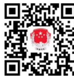
苏家屯区司法局权力事项清单